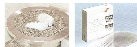
THERMOFORMAGE DU DURAN AVEC LA MACHINE BIOSTAR

Chaque gouttière est portée par le patient pendant environ 21 jours, en commençant par la gouttière d'épaisseur 0.50 mm.