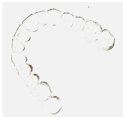
GOUTTIERE THERMOFORMEE EN DURAN