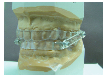
Orthèse sur le modèle