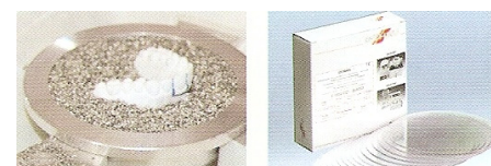
THERMOFORMAGE DU DURAN AVEC LA MACHINE BIOSTAR

Chaque gouttière est portée par le patient pendant environ 21 jours, en commençant par la gouttière d'épaisseur 0.50 mm.