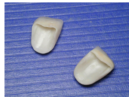
FACETTE SUR ARMATURE ZIRCONIE