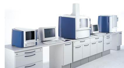
USINEUSE NUMERIQUE EVEREST

Toutes nos armatures en zirconie sont garanties 5 ans.