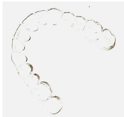
GOUTTIERE THERMOFORMEE EN DURAN